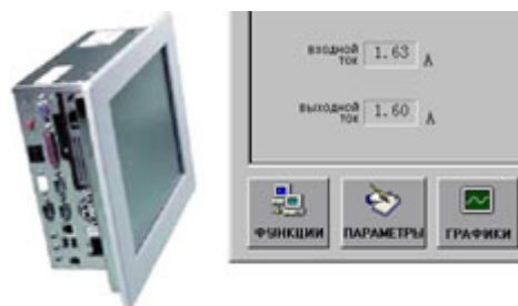
Панель оператора и окно пользовательского интерфейса

Система управления ВПЧ реализована на базе промышленного компьютера оснащенного сенсорным экраном.